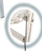
Lunetas de unión de aluminio fundido