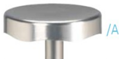
527/A Exteriores - SI